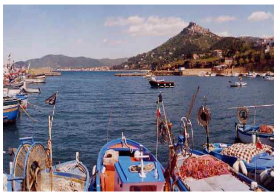
San Marco di Castellabate