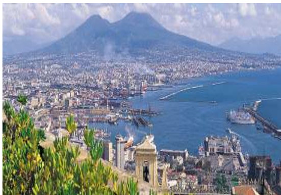
Neapel mit Blick auf den Vesuv

Staatlich anerkannte Einrichtung der Weiterbildung nach dem Weiterbildungsförderungsgesetz M-V