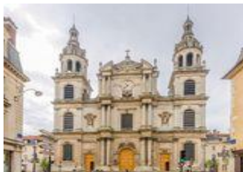
Kathedrale in Nancy