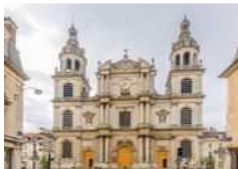
Kathedrale in Nancy